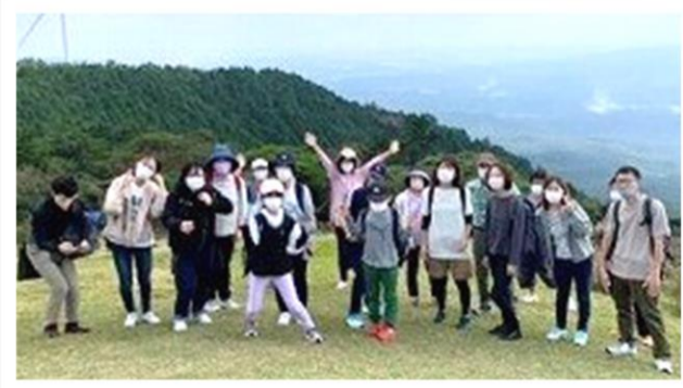
記念撮影📷 山のひんやりした風が 心地よかったです