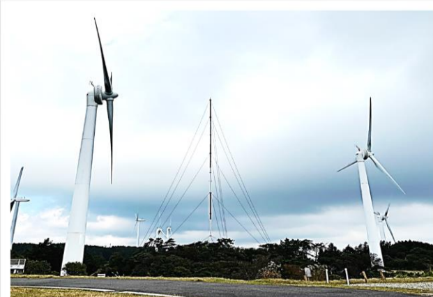
ゴール! 運動後の昼食は格別でした