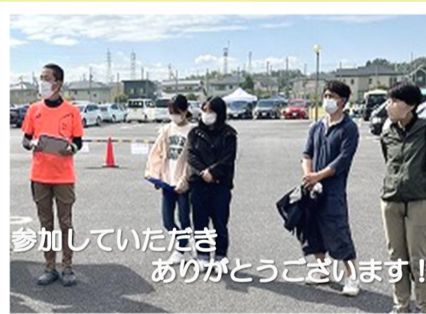
参加していただき ありがとうございます!