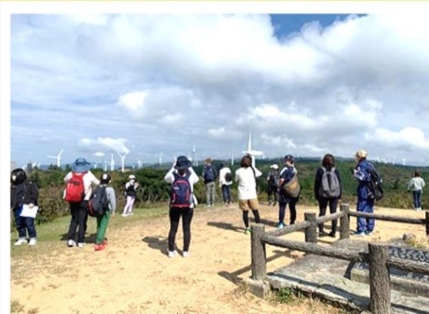
髻山三角点からの風車群 近くに見える風車は圧巻です